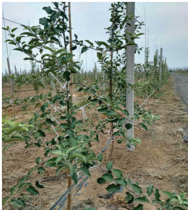
图8 拉枝完成后落叶前

(8)不能只拉下边枝而不拉上边枝,上枝、下枝都要拉到位。拉枝要处理好个体与群体的关系。