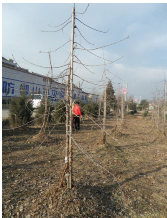
图9 拉枝完成后落叶后